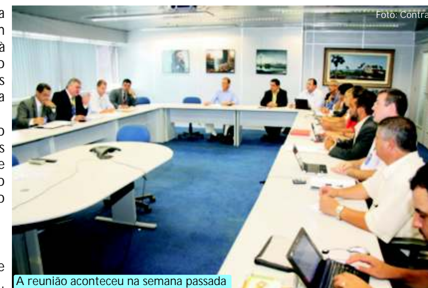
A reunião aconteceu na semana passada

com previsão para distribuição de dividendos em 10 de março.